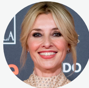
Cayetana Guillén Cuervo