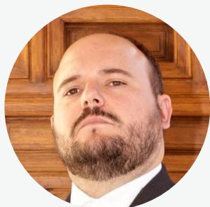
Niño de Elche